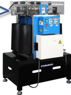
ギガサイクル回転曲げ疲労試験機 (同時4連式疲労試験機×4ユニット)