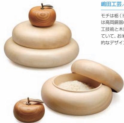
鏡餅飾り 嶋田工芸/砺波市

表面は鏡肌、裏面はウーベ(起毛)張りで机面に傷がつかないようにしている。小物、名刺、メモ、マネーレイなど用途は幅広い。パリエーションとして伝統着色を施してある黒ムラシシリーズもある。 デザイン 大治 将典