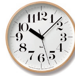
RIKI CLOCK RC 株式会社タカタレムノス/高岡市

「RIKI CLOCK」の電波時計バージョン。美しいデザインに機能を充実させ、時計として必要な要素を極めた商品。使いやすい大きさを考慮し、現行の中間サイズとした。