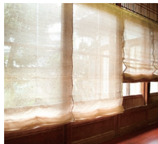
SHIKE SILK SHADE 株松井機業/南砺市

県内で松井機業のみが織っている貴重な「しけ絹」のシェード。※しけ絹…二頭の蚕が一緒に一つの繭を作ることが稀にあり、そこからできる糸で織りあげたもの。