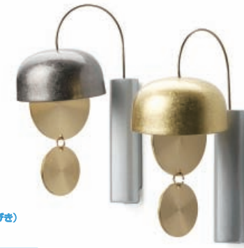
優美シリーズ どおりん 響(ひびき) 株式会社山口久乗/高岡市

広く豊かにたゆたう音は、速くにも近くにも大切な人の出入りを知らせてくれる。深くやさしく響くおりん。