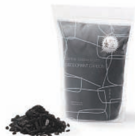
炭草花 デオドラントカーボン アイオーティカーボン株/富山市

筒シモタニ製ペレットストーブの美しいフォルムに、高岡で受け継がれた金属着色を施した限定モデル。 着色 街モメンタム・ファクトリー・Orii