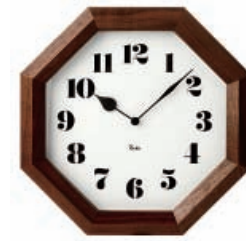
八角の時計 株式会社タカタレムノス/高岡市

左から 01.vanilla, 02.chocolate, 03.strawberry