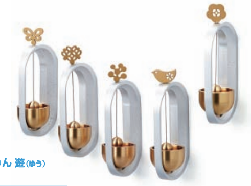
優美シリーズ どおりん 遊(ゆ) 株式会社山口久乗/高岡市

あたま飾りの蝶や葉っぱがひらひら、くるくるゆれながらかわいいうつろい遊ぶ。気分が楽しくなるおりん。