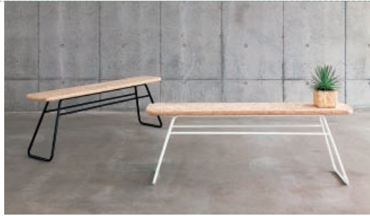
ベンチ chiiシリーズ ch02 usuiworks株式会社/富山市