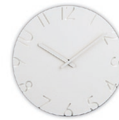
CARVED 株式会社タカタレムノス/高岡市

グラフィックをフォルムとして扱うことを試みている。彫り込まれた文字の落とす陰影が文字盤に立体感を与え、周囲の光環境に応じて表情を変える。