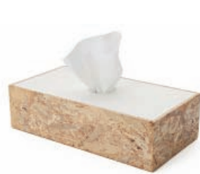
ティッシュケース chiiシリーズ ch07 usuiworks株式会社/富山市