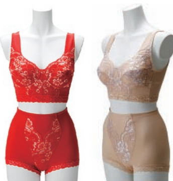
Benea(ベネア) 北陸エステアール協同組合/南砺市

ニオイのこもりがちな引き出しや下駄箱、衣類箱に最適な脱臭アイテム。3サイズの展開なので広さに応じて使うことができる。