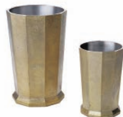
道具立て 株二上/高岡市

モチは栃(トチ)材。みかんは榎(ケヤキ)材。葉は高岡銅器の鋳物。伝統工芸庄川挽物の生地加工技術と木目の美しさが特徴。中が空洞になっていて、お米や餅を入れてお供えに使える実用的なデザイン。