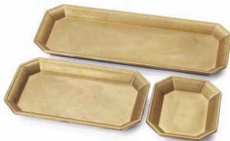
文具トレイ 株二上/高岡市

シニア向けインナー。簡単に装着できるよう、よく伸びる素材を使用。生地裏は綿混素材を使用し、締め付けのない柔らかな仕立てをしている。富山県工業技術センター生活工学研究所と総合デザインセンターとの共同開発。製造はすべて富山県内。