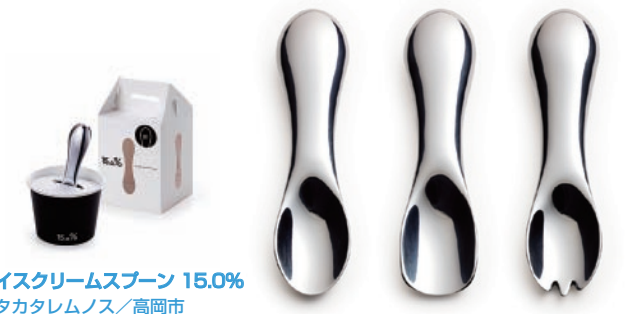
アイスクリームスプーン 15.0% 株式会社タカタレムノス/高岡市

手の平に馴染むふっくらとした形が特徴的。素材はアルミニウムの無垢。熱伝導率の高さを利用して、スプーンを持つ手の体温で溶かしながらすることができる。