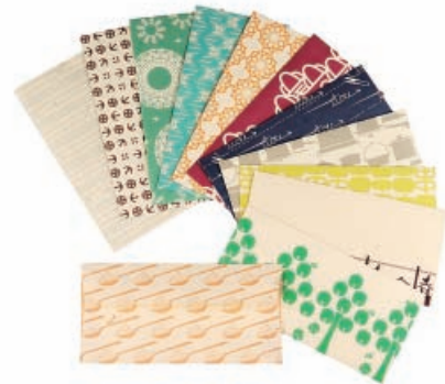
苗字封筒 有桂樹舎/富山市