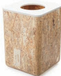
ゴミ箱 chiiシリーズ ch06 usuiworks株式会社/富山市