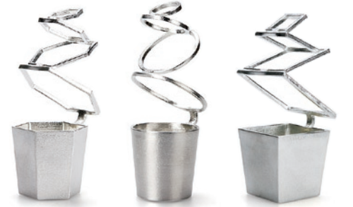
花器 HOOP 株式会社能作/高岡市

錫の性質によりリングの部分を自由に変形させて使用できる。花を生けた姿は、まるでお花がフラーフープをしているよう。