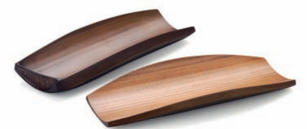
竹拭漆ハツリ面舟形盛器 南部 治夫/富山市

富山市呉羽丘陵産で肉厚の孟宗竹を原材料とし、ナタヤノミによるハツリ面を底部にマッチエールとして活かした商品。