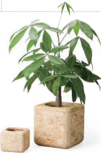
プランター chiiシリーズ ch09 usuiworks株式会社/富山市