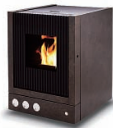
コンコード・エマーソン「高岡着色」モデル 平和エネルギー株/高岡市

筒シモタニ製ペレットストーブの美しいフォルムに、高岡で受け継がれた金属着色を施した限定モデル。 着色 街モメンタム・ファクトリー・Orii