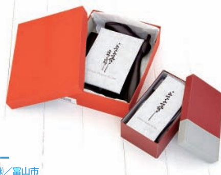
炭草花 フォー・ドロワー アイオーティカーボン株/富山市

高機能木炭の粒を好みの器や袋に入れて使用できる脱臭剤。ガーデニングなどの土壌改良木炭として土に混和させるのもおすすめ。