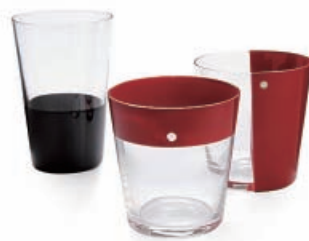
DEN Old Glass, Tumbler Glass 天野漆器株/高岡市

真鍮の重さを活かして、お玉や箸など背の高いものを入れても倒れにくくなっている。内側に銅引きを施している。 デザイン 大治 将典