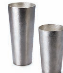
ピアカップ 株式会社能作/高岡市

錫100%の素材によるピアカップ。砂型の鋳肌を活かした仕上げにより、きめ細かい泡立ちになる。