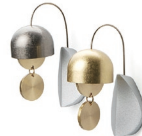
優美シリーズ どおりん 果(しずく) 株式会社山口久乗/高岡市

水のしたたる音、川のせせらぎのように、清々しくさりげなく、暮らしに溶け込む音。何個でも使ってみたくなるおりん。