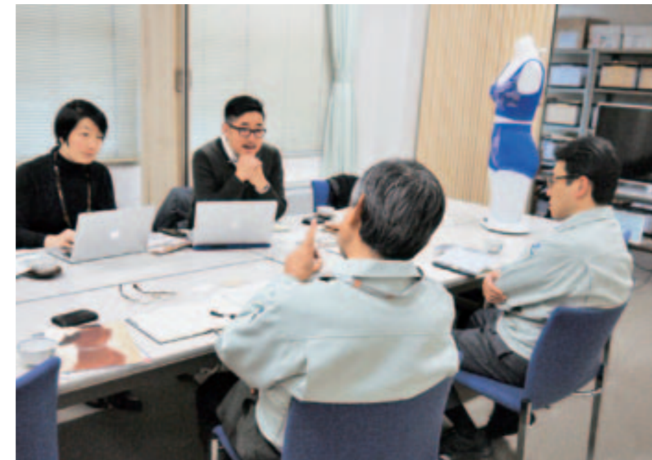
ブランド開拓事業の専門家によるヒアリングの様子