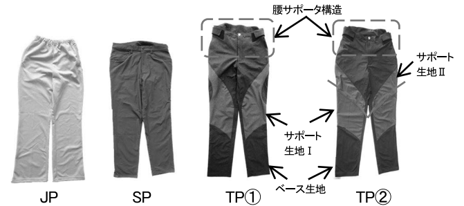
Fig. 2 Pants for wearing experiments

較対象とし、試作パンツ① (TP①)、試作パンツ② (TP②) の計 4 種の実験用パンツを健康な成人男性 1 名に着用させ、簡易人体ダミー (1200mm/40 kg) を用いて介助動作を行ったときの活動筋の筋電図を測定した。